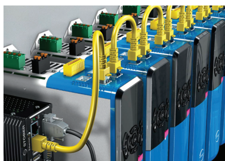
Servoměniče řízené STÖBER Motion kontrolerem MC6 po síti EtherCAT