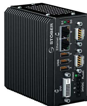
Motion kontroler MC6 – kompaktní verze