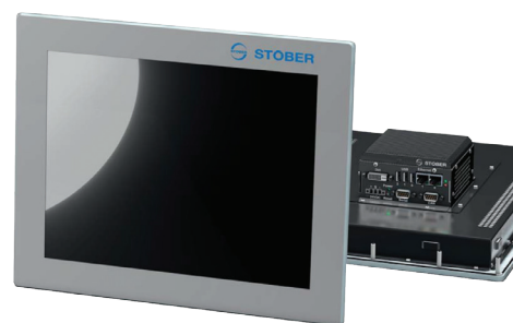
Motion kontroler MC6 – verze s dotykovým displejem

STÖBER: Kompletní řízení od jednoho výrobce