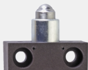
Kulový píst KU