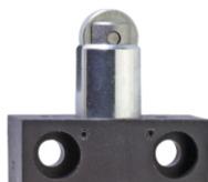
Píst s kladkou R

materiálu 1045242 1188782 Na požádání Na požádání