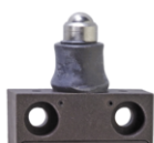
Kulový píst s límcem WKU

materiálu 1188774 1044953 Na požádání Na požádání