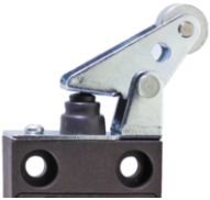
Paralelní páčka s kladkou a límcem WPH

Číslo materiálu 1188929 1045150 Na požádání Na požádání