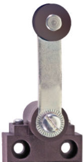
Dlouhá kyvná páčka DL

Číslo materiálu 1045179 1045178 Na požádání Na požádání