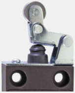
Vyvážená páčka s kladkou a límcem WHK

Typ ES 13 WHK 1Ö/1S - 2m ES 13 WHK 1Ö/1S - 5m ES 13 WHK-S 2Ö/1S - 2m ES 13 WHK-S 2Ö/1S - 5m