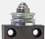
Kulový píst pro čelní montáž FKU

materiálu 1188781 1044972 1032214 Na požádání