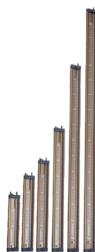
MMK - extrémně robustní manometr