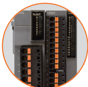
Jednoduché zapojení. Svorkovnice s pružinovými svorkami