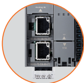
Dual Ethernet port. Jeden port může být nastaven pro datovou komunikaci jako je FTP, Web Server a E-mail. Druhý port může být nastaven pro řídicí síť včetně Modbus TCP.